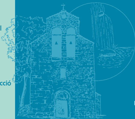
Sant Martí d'Ogassa

L'obaga frondosa de ca la Janica Paisatge "lunar" dels Moltons Els masos abandonats La recuperació de la cobertura forestal Els prats de pastura La ramaderia Els rapinyaires Els isards Circ glacial a l'estany del Tarter Les flors d'alta muntanya i la seva protecció L'ermita de Sant Martí d'Ogassa Les mines i la vida minera a Ogassa